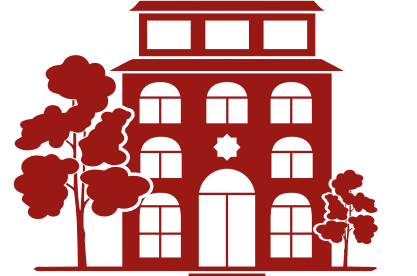
HALIÇ UYGULAMA ve ARAŞTIRMA YERLEŞKESİ