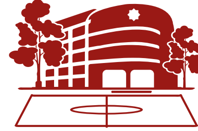
BOSTANCI UYGULAMA ve ARAŞTIRMA YERLEŞKESİ